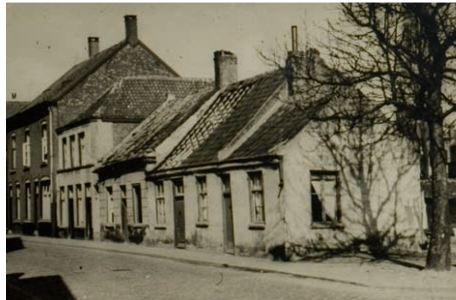
Het Groenewoud, gezien in de richting van de Kerkstraat. Rechts de toegang tot het Groenpad dat achter de huizen doorloopt naar het Beugelsplein. In het meeste linkse witte pand was de koekfabriek gevestigd.