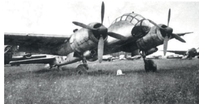
Met de productie van een beperkt aantal rompen voor de Junkers Ju 88A werd in 1944 bij Fokker Helmond begonnen. D-1142 De Junkers Ju 388L-0, de moderne Duitse bommenwerper, die mogelijk in Helmond geproduceerd zou gaan worden.

gemerkt 'Hispano', bestemd voor de Fokkerfabriek te Helmond. Op 14 augustus werd een bombardement uitgevoerd op het haventje van Veghel, waarbij ook een schip met onderdelen voor Fokker zou zijn getroffen. Fokker Helmond heeft, zowel bij Robur als in de hal van De Wit, tot begin september 1944 geproduceerd, hoewel vanaf half augustus het werk al bijna geheel stil lag. In het verslag van de bevrijding van Helmond werd op 4 september nog bericht: "Fokker geeft kennis dat zij vanaf heden geen meldingen voor luchtgevaar meer zullen doorgeven".