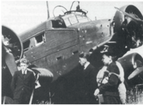
Duidelijk zij de drie BMW-motoren van het Ju 52 vliegtuig te zien.