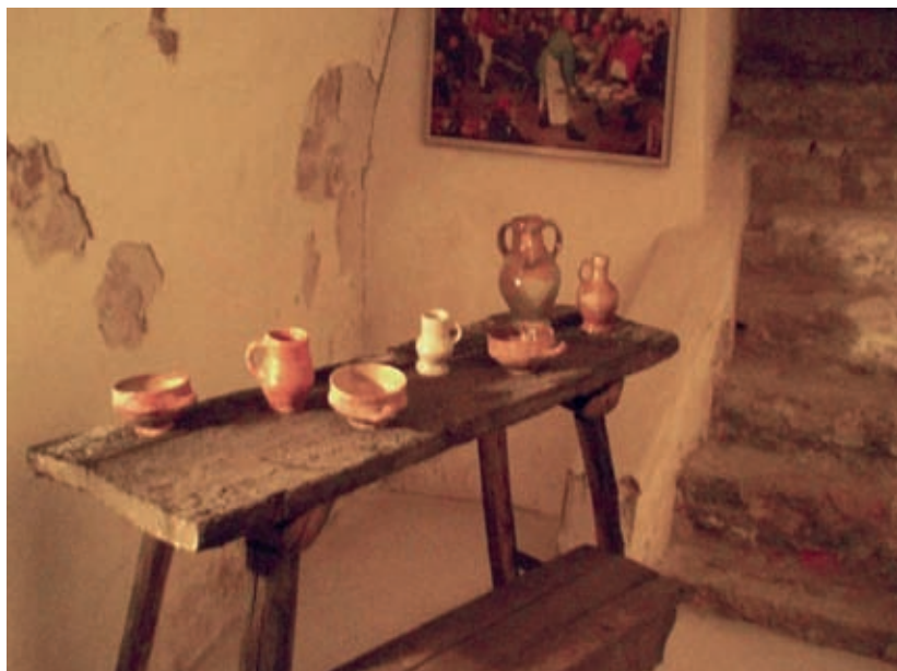
Een beeld van de expositie van gebruiksvoorwerpen in de historische kelders van het Huis met de Luts. Ze werden beschikbaar gesteld door het Gemeente Museum Helmond.

De expositie, die gratis toegankelijk is, kwam tot stand in samenwerking met het Helmonds Gemeentemuseum die de voorwerpen in bruikleen gaf. De foto's werden door het Regionaal Historisch Centrum (RHCE) en Heemkring Helmond-Peelland ter beschikking gesteld.