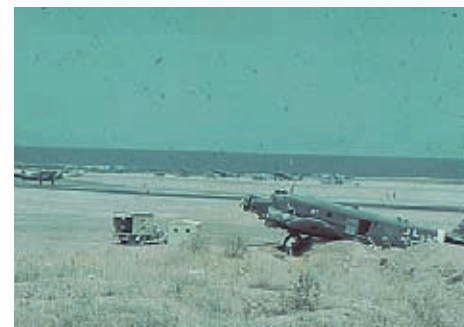
Voor het Junkers Ju 52 transportvliegtuig werden in Helmond roeren en stuurvlakken geproduceerd. Hier een tweetal van dergelijke toestellen op Kreta.

In eerste instantie betrof het werk de reparatie van vleugels en motorgondels van Junkers Ju 52 transportvliegtuigen. Maar al snel werd ook de assemblage van stabilo's, kielvlakken en staartroeren voor de Ju 52 en de revisie van BMW 132 vliegtuigmotoren van de hallen aan de Amsterdamse Coenhaven, overgebracht naar Helmond. De activiteiten van Fokker in Helmond bleven niet lang geheim. Al in januari