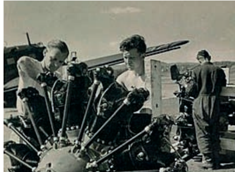
De BMW 132A motor. Van dit type motor bleef een groot aantal achter in Helmond.

niet duidelijk wat met deze restanten van een kortstondige vliegtuigproductie in Helmond is gebeurd.