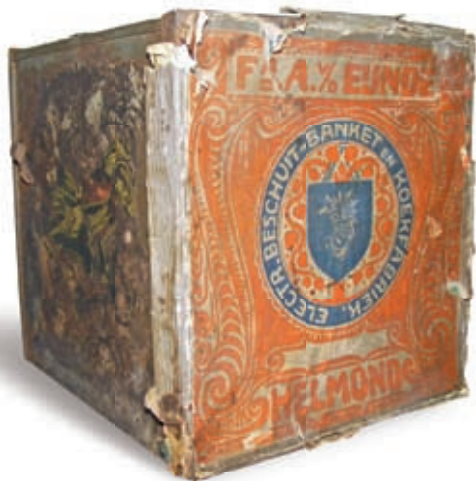
Dit uniek speculaasblik van de Electr. Beschuit- Banket- en Koekfabriek werd onlangs teruggevonden. Het blik bevindt zich in het Edah museum in Helmond.

overnam. Dat het toen al een Elektrische Beschuit- Banket- en Koekfabriek betrof, is ongeloofwaardig. Enkel als de bakkerij van een elektrische aandrijfkracht gebruik maakte, kon het als elektrisch worden beschouwd. Het elektriciteitsnet werd in Helmond pas omstreeks 1910 in gebruik genomen, dus moet de bedrijfsnaam later ontstaan, cq gewijzigd zijn.