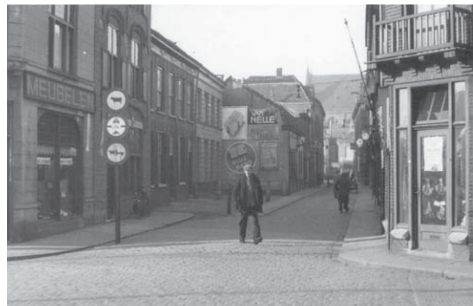
Het nog smalle Meistraatje met links de panden van bakker v/d Eijnde en slager Vriends. Duidelijk is de engte van het straatje te zien.

In die tijd was het smalle Meistraatje nog niet volledig bebouwd. Op braak liggende terreinen bevonden zich verschillende (groente) tuinen. Op een foto, die in 1912 van de toegang werd gemaakt, is te zien dat het straatje toen