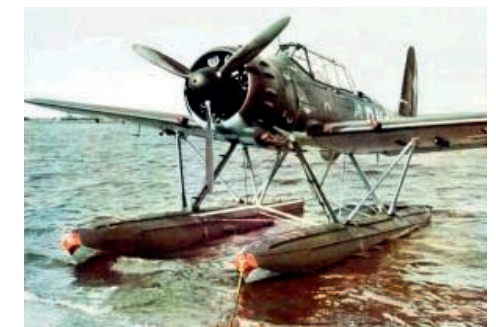
Ook voor het Arado Ar 196A drijvervliegtuig werden in Helmond vleugeldelen, stuurvlakken en gedurende een korte tijd ook drijvers gebouwd.

De productie van deze onderdelen zou niet soepel verlopen doordat onderdelen, die van elders moesten komen, veelal met aanzienlijke